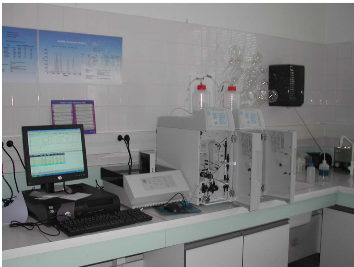
Ensemble de chromatographie ionique ICS-1000 installé au laboratoire d'analyse des eaux de l'UMR 5569- Hydrosociences, Maison des Sciences de l'Eau de Montpellier